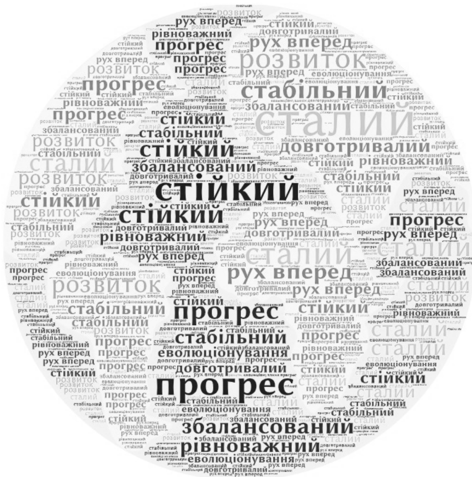
Рис. 3. Хмара слів до поняття «Сталый розвиток», розроблена студентами магістратури при вивченні дисципліни «Глобальна стратегія сталого розвитку»

Серед стратегічних цілей розвитку освіти визначено її переорієнтацію на цілі сталого розвитку. Наводимо на рис. 3. приклад розроблених студентами хмар слів до поняття «сталий розвиток» з використанням цифрових інструментів візуалізації.