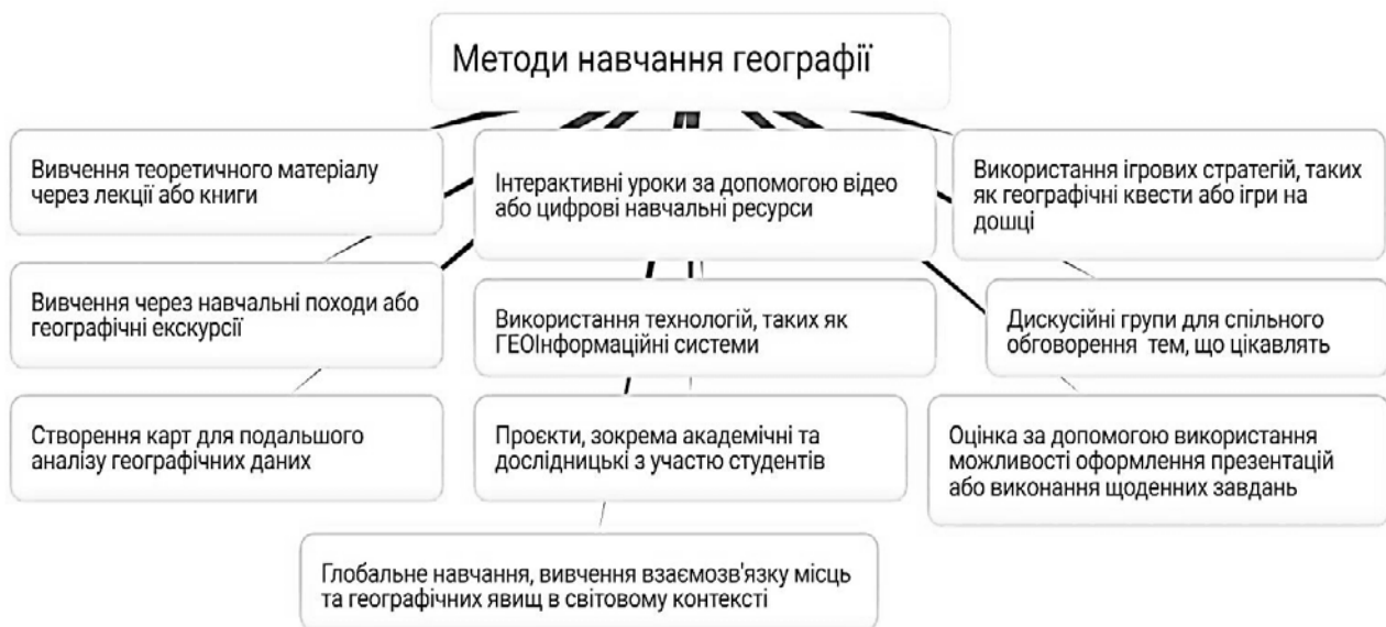
Рис. 4. Ментальна карта «Методи навчання географії», створена генератором ідей штучного інтелекту ChatGPT в онлайн застосунку Bubbl.us

освіті сприяє покращенню залученості студентів та результатів навчання (Документація OpenAI...). На рис. 4 наведено ментальні карти, згенеровані ChatGPT в онлайн застосунку Bubbl.us.