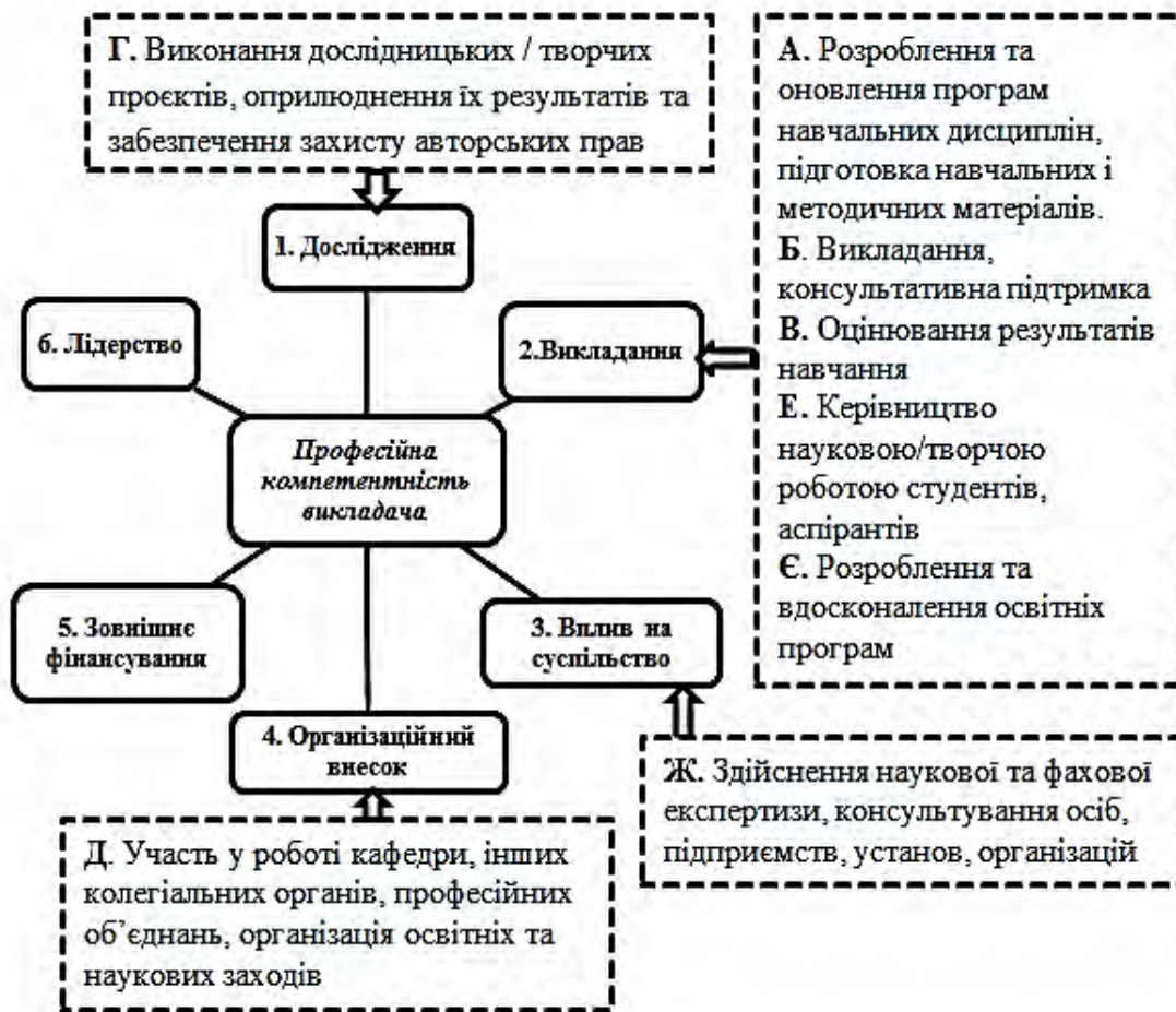
Рис 2. Кластер співвідношення вимог до професійної компетентності викладача за професійним стандартом України (обведено пунктиром) і критеріїв Копенгагенського університету (обведено суцільною лінією).

Продуктивними також є виконання завдань на контент-аналіз освітніх програм «Середня освіта (Географія)» першого (бакалаврського) рівня вищої освіти, по яким зараз навчаються студенти із 1-го по 4 курс, та пошук відповіді на питання: «Які зміни відбулися? Що є базисом (незмінним ядром) ОП?» Порівняння освітніх програм групи спеціальності «014. Середня освіта» різних предметних спеціальностей спрямоване на визначення спільного/подібного у наведених компетентностях.