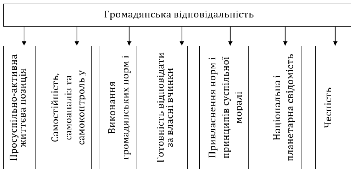
Рис. 1. Компонентний склад громадянської відповідальності

Проведений нами аналіз результатів досліджень з розуміння