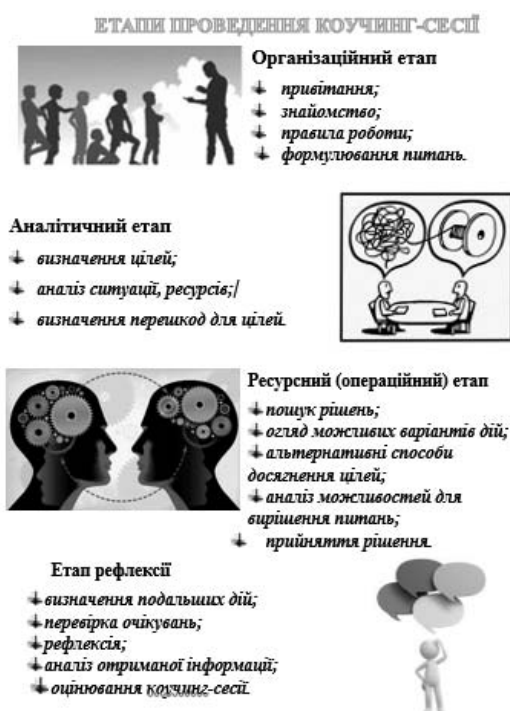
Рис. 2. Етапи проведення коучинг-сесії (інструкція до виконання завдання)

тетів. Особливо пізнавальною, цікавою, нестандартною формою здобувачі відмітили проведення коучинг-сесій. Після коучинг-сесії на тему «Протидія булінгу у ЗЗСО» було запропоновано творче завдання, суть якого полягала у розробці власної коучинг-сесії та презентування фрагменту її проведення. Здобувачі отримали відповідну інструкцію щодо етапів проведення коучинг-сесії (рис.2)