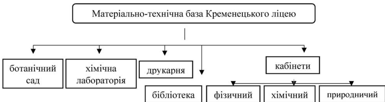
Рис. 2. Матеріально-технічна база Кременецького ліцею (поч. XIX ст.)

Дані рис. 2 засвідчили полідисциплінарність навчального плану зазначеного ліцею для: вивчення хімії – хімічний кабінет і лабораторія; опанування природничих наук – ботанічний сад і профільний кабінет; освоєння фізичних законів – спеціально обладнаний кабінет (Собчук, 2009).